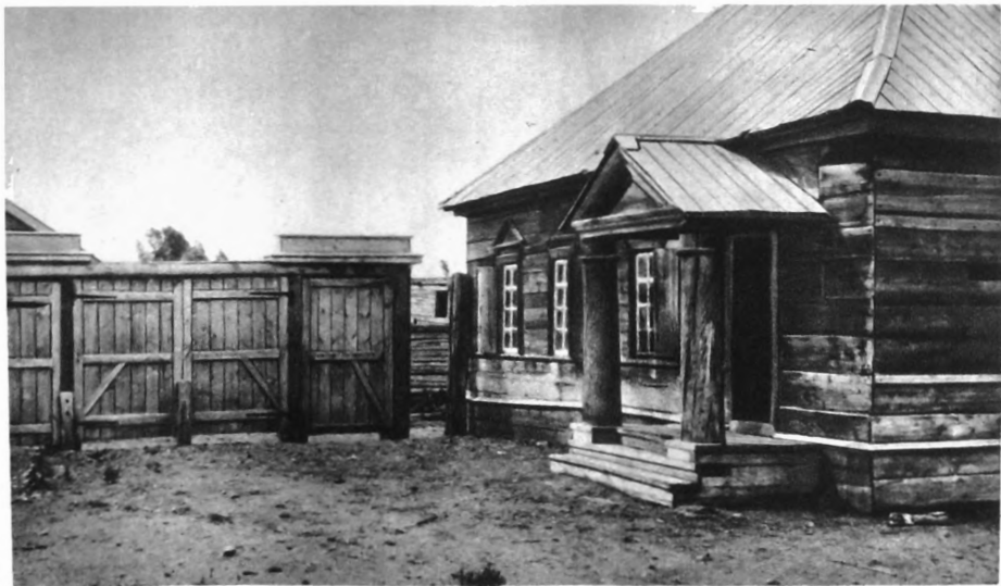
Дом, в котором жил В. И. Ленин во время ссылки в с. Шушенском