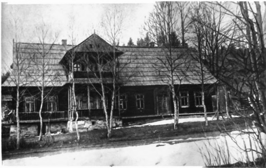
Дом в Поронине (Польша), в котором жил В. И. Ленин летом 1913 и 1914 гг.