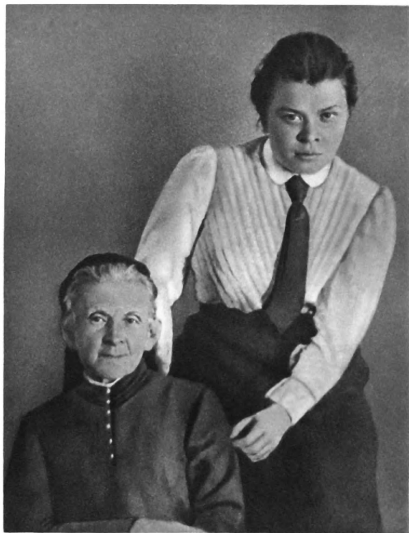
М. А. и М. И. УЛЬЯНОВЫ