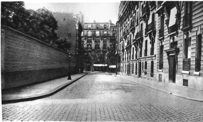
Общий вид улицы Marie Rose (Париж), где в 1909 — 1912 годах в доме № 4 жил В. И. Ленин