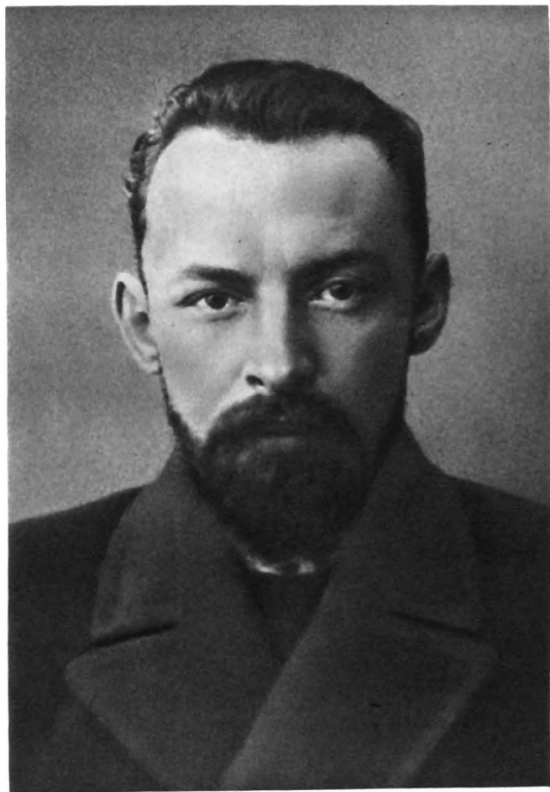
Д. И. УЛЬЯНОВ