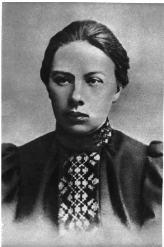
Н. К. КРУПСКАЯ