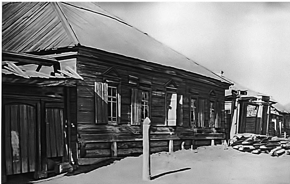
Дом в селе Шушенском, в котором жил во время ссылки В. И. Ленин. Два крайних окна слева — окна комнаты Ленина.